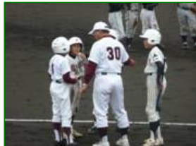
監督の指示を真剣に聞く有川選手達