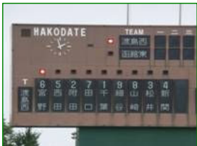
有川選手達が電光掲示板に名を連ねる