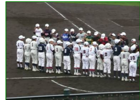
雨の中、健闘を称え合う両チーム