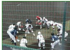
最後まで全カプレーと円陣を組む渡島西