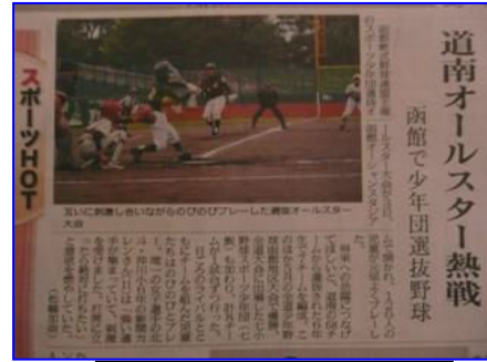
10/4北海道新聞夕刊《みなみ風》から